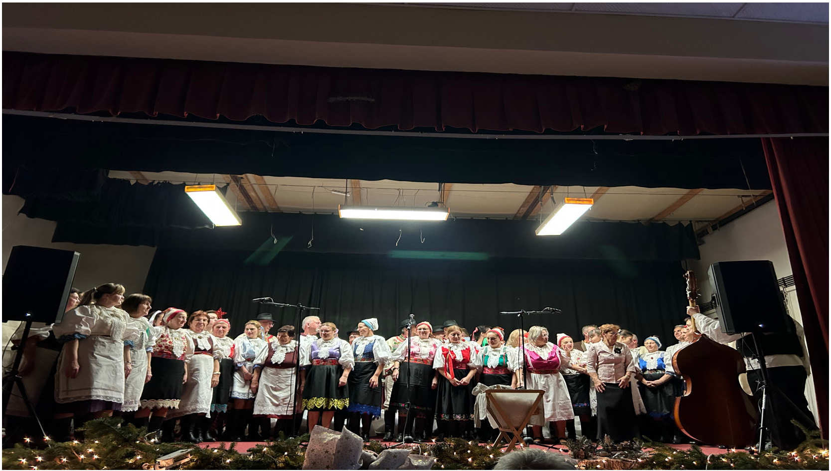
Kultúrne Vianoce v obci Prázňovce