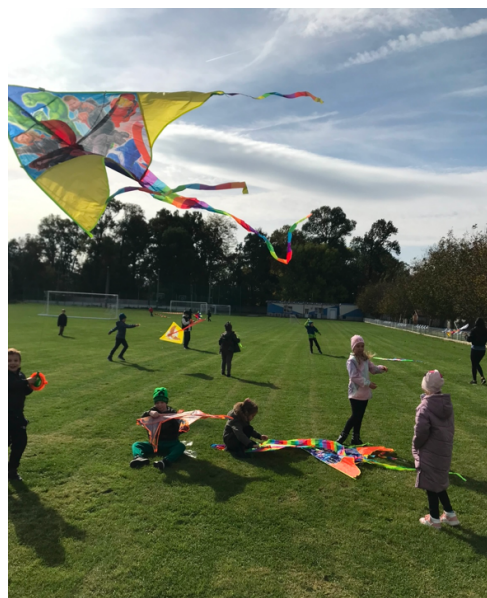
Púšťanie šarkanov - deti Základnej školy