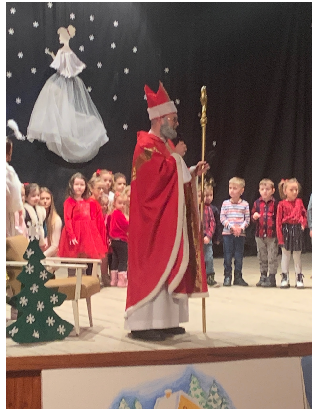
Mikuláš v Oponiciach