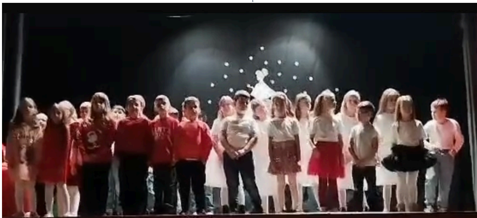
Mikuláš v Oponiciach