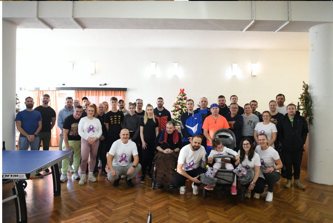
1.ročník Vianočného stolnotenisového turnaja

Názory zverejnené v Oponickom spravodajcovi sú názormi konkrétneho prispievateľa. Tieto názory sa nemusia zhodovať s názorom redakcie. Redakcia si vyhradzuje právo nezverejňovať príspevky, ktoré z obsahového hľadiska nezodpovedajú zásadám slušného chovania a príspevky, ktoré neoprávnene útočia na dobré meno a česť iných občanov. Svoje príspevky, informácie, otázky a inzeráty zasielajte na adresu obecného úradu. Môžete požiadať o zasielanie viac výtlačkov do domácnosti s viac čitateľmi a taktiež o vyradenie vašej domácnosti zo zoznamu distribúcie spravodajcu. Periodicita vydávania regionálneho občasnika je minimálne dvakrát ročne.