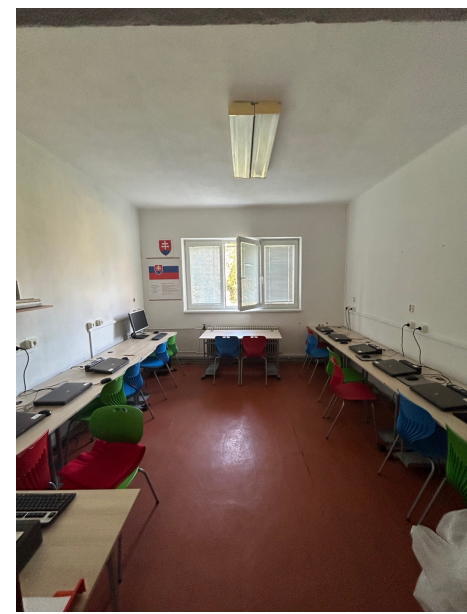
Vynovená počítačová učebňa v Základnej škole