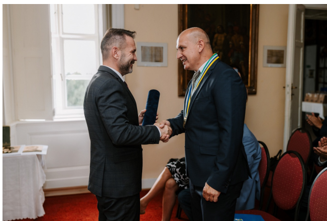
Odozdvávanie pamätného listu predsedom Nitrianskeho samosprávneho kraja