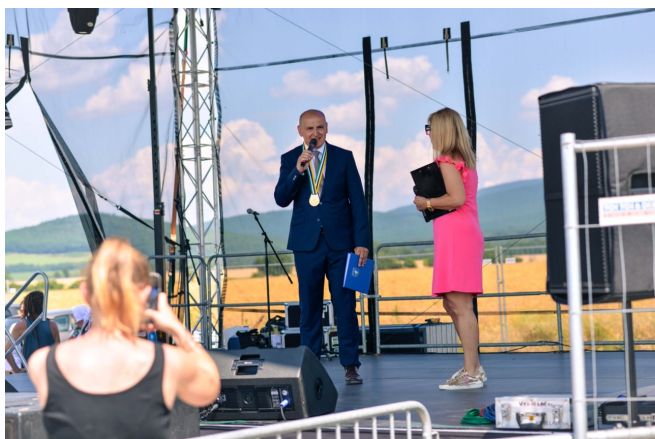
Príhovor starostu obce Oponice